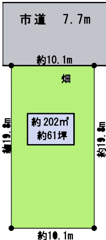
敷地図 変更になる事があります。